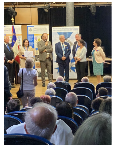
Prix National de l'Éducation à la citoyenneté